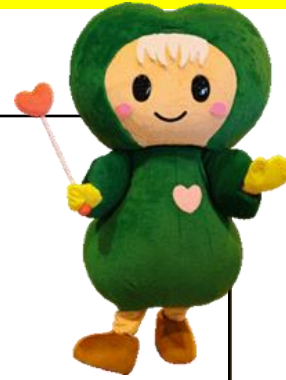
秩特マスコット 「チッチ」です!